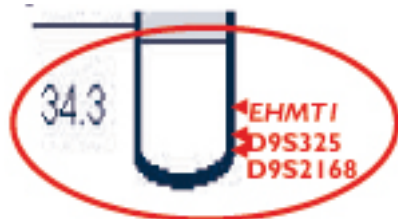
De lange arm van chromosoom 9. De rode lijn geeft de plaats aan van de 9q34 microdeletie. Het diagram toont een vergroting met de plaats van het EHMT1 gen en twee markers die men gebruikt in een FISH diagnose.